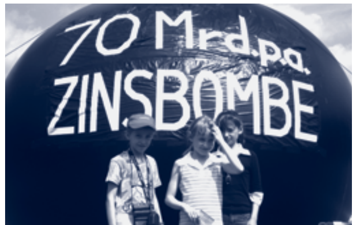
Was uns die Erwachsenen da einbrocken...

Und ist es mit der Glaubwürdigkeit in folgender Hinsicht nicht ohnehin schon vorbei? Die Bundeswehr soll der Landesverteidigung dienen. Die aber steht schon lange nicht mehr auf dem Lehrplan der Rekruten, sie gehört nicht einmal mehr zur mentalen Grundausrüstung der Soldaten, wie Generäle offen zugeben. Landesverteidigung, die durch un-